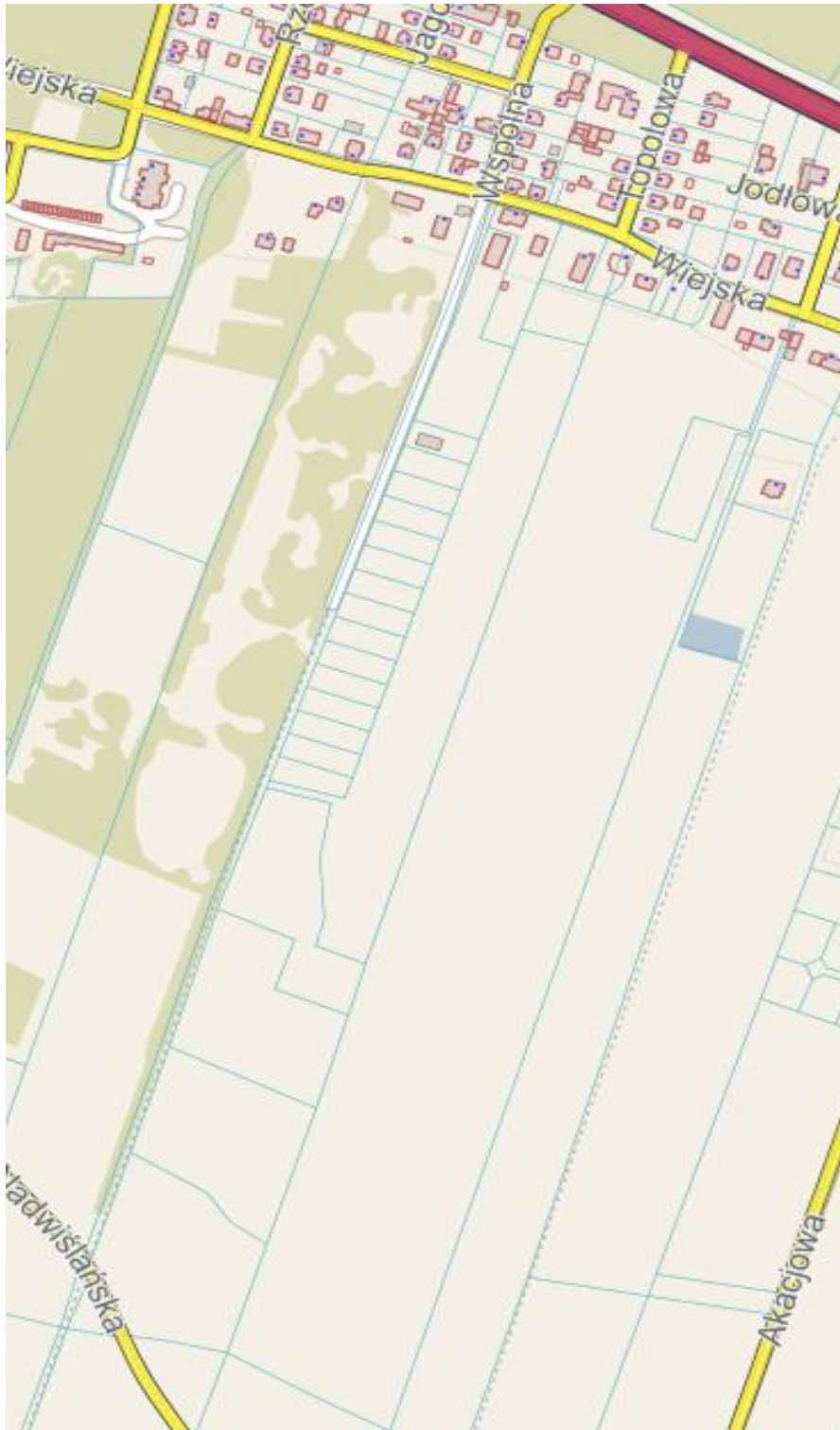
Działka 61/1 w miejscowości Górsk - ulica Wspólna (przedłużenie)

Załącznik nr 7 do uchwały Nr IX/45/2024 Rady Gminy Zławieś Wielka z dnia 17 grudnia 2024 r.