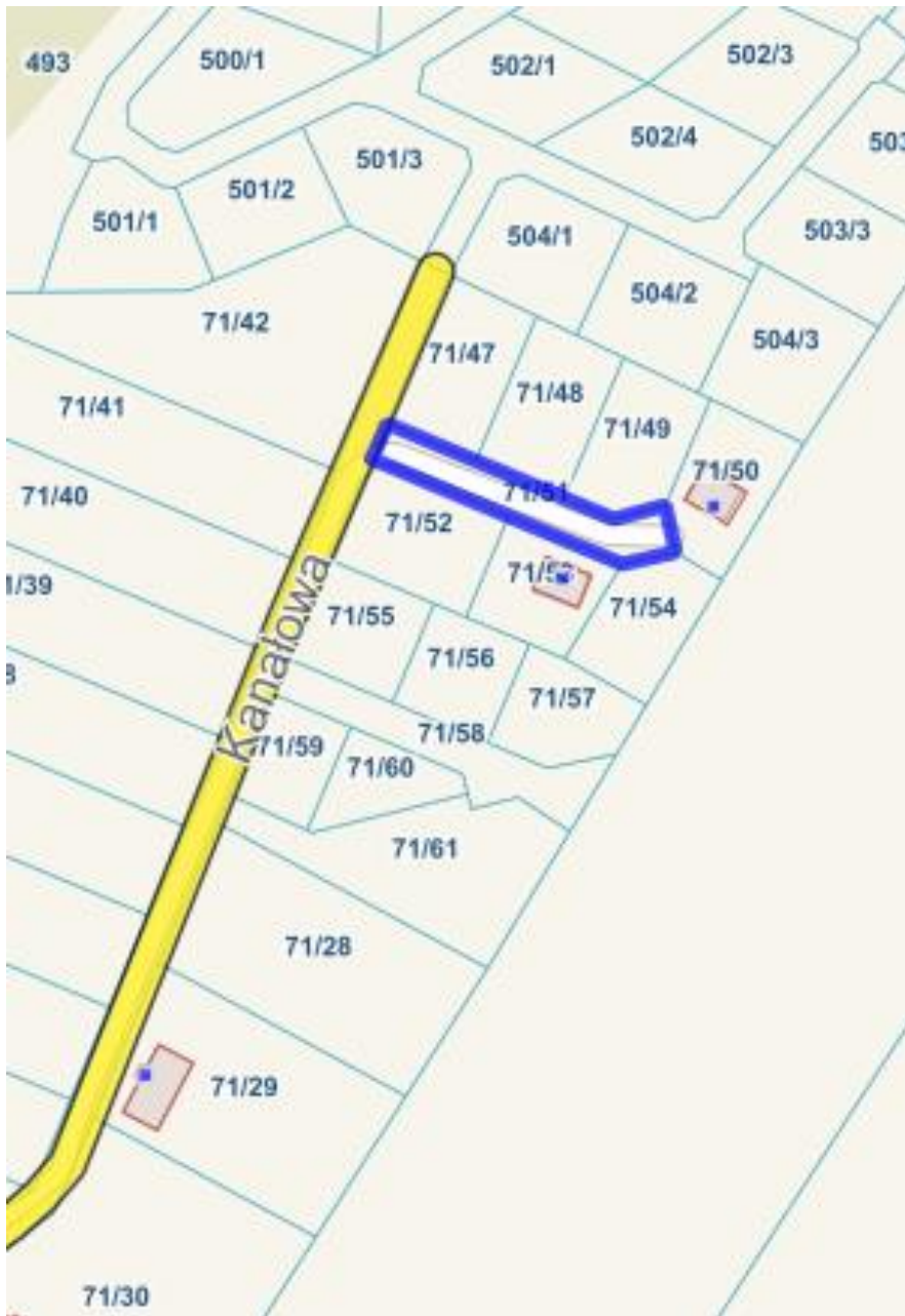
Działka nr 71/51 u miejscowości Zławieś Mała ulica Wichrowa

Załącznik nr 5 do uchwały Nr IX/45/2024 Rady Gminy Zławieś Wielka z dnia 17 grudnia 2024 r.